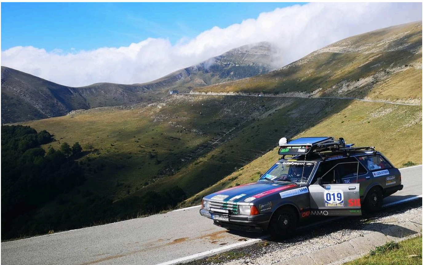
Was für ein Ausblick bei einem Halt in den Pyrenäen