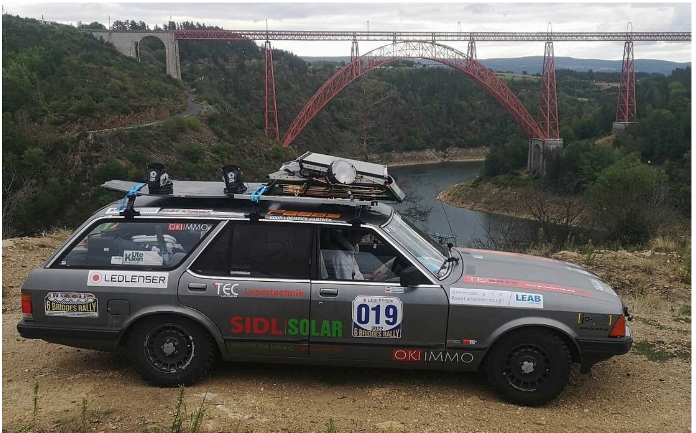
Zwischenstop am Viaduc de Garabit in Frankreich.